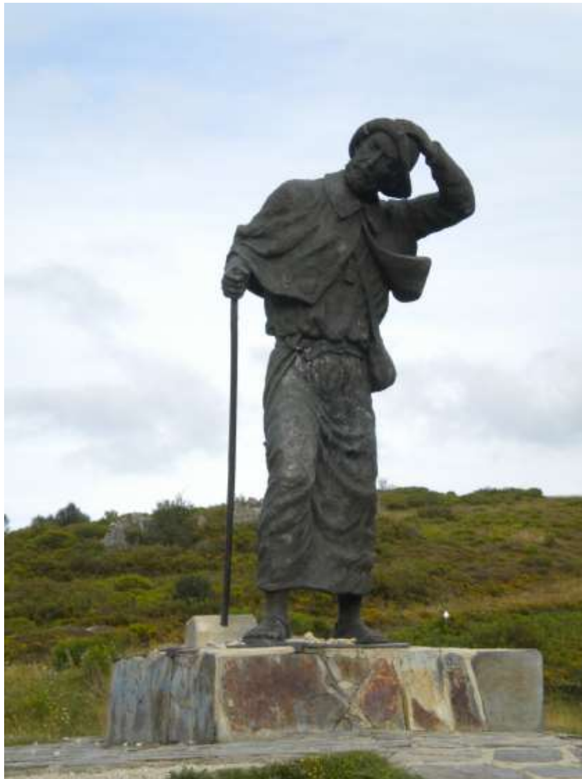
Alto de San Roque - Galizia

(tratto da "Il Cacciatore Errante", Luca Di Bianca, Gruppo Albatros Editore)