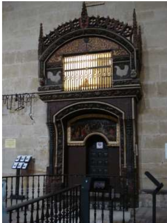
il "gallinero" - Santo Domingo della Calzada

Narra la leggenda che nel 1300 una famiglia, padre, madre e figlio, in pellegrinaggio da Colonia verso Santiago, si fermò per la notte in una locanda di Santo Domingo; la figlia del locandiere, colpita dalla bellezza del ragazzo, cercò di attirarne l'attenzione, ma il giovane non si fece sedurre e per vendicarsi la ragazza gli nascose nella sacca un piatto d'argento. Il giovane fu accusato di furto e venne catturato e impiccato come ladro. I genitori continuarono il pellegrinaggio e al ritorno si fermarono nella stessa locanda, trovando il figlio ancora vivo; il ragazzo raccontò di essere stato salvato da San Giacomo che gli aveva tenuto le gambe mentre veniva appeso alla corda, ma il padre gli avrebbe creduto solo se i due galletti arrostiti che gli erano stati serviti avessero ripreso vita; subito i due galletti riacquistarono le piume iniziando a cantare. In ricordo di questa leggenda all'interno della cattedrale ci sono due galline nella struttura del "gallinero".