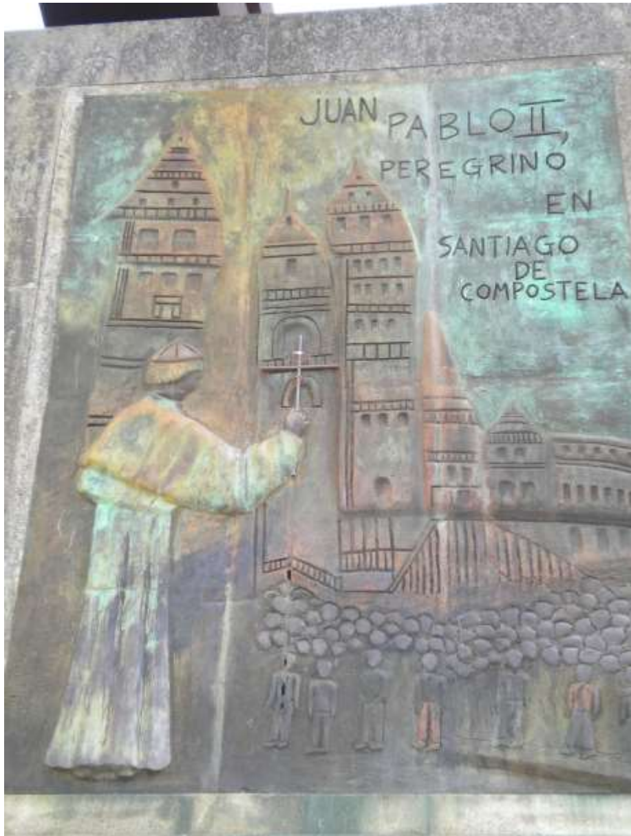
Monte Gozo – Santiago de Compostela

Il filo che sembrava annodato riprendeva a srotolarsi e la gente ricominciò a camminare. Passa ancora un secolo e nel 1985 l'UNESCO dichiara il Cammino di Santiago Patrimonio mondiale dell'Umanità; nel 1987 il Consiglio d'Europa lo riconosce come base della formazione culturale europea e nel 1989 Giovanni Paolo II dà appuntamento a Santiago de Compostela ai giovani di tutta Europa.