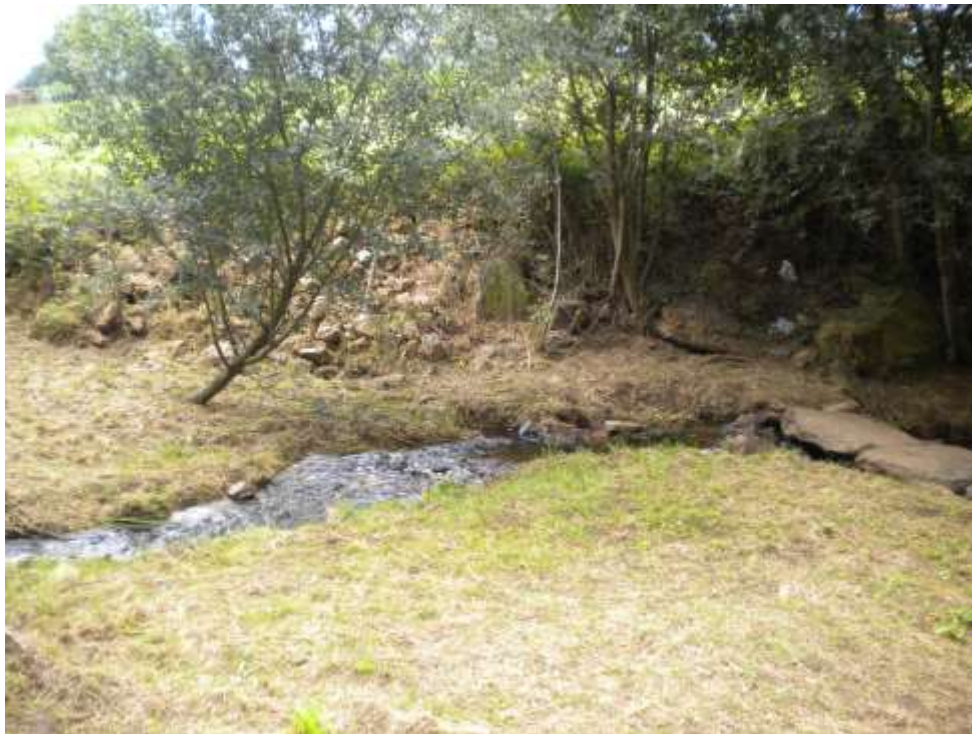
quello che rimane del fiume Lavamentula, Lavacolla

Oltre al significato di una semplice pulizia corporale dopo tanto sudore, c’è quello più profondo di una generale purificazione. Da qui c’è l’inizio dell’ultima salita verso il MONTE GOZO, il Mons Gaudii ovvero il “monte della gioia”, chiamato così perché dall’alto della collina i pellegrini medievali vedevano per la prima volta le guglie della cattedrale di Santiago e ringraziavano il Signore per essere giunti sani e salvi alla meta.