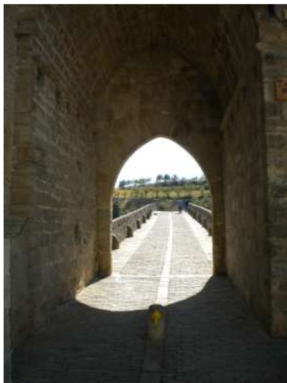
Puenta la Reina

Si lasciano i Pirenei e si va verso Pamplona, prima grande città lungo il Cammino, per poi giungere al paese di PUENTA LA REINA, famoso perché qui si uniscono da sempre le due vie che provengono dai valichi di Roncisvalle e di Somport. E' uno dei luoghi in cui è più forte la presenza del passato e la storia del Cammino; la città deve il suo nome al ponte pedonale ad archi sul rio Arga, costruito in epoca medievale su ordine della regina dona Mayor per facilitare il passaggio dei pellegrini.