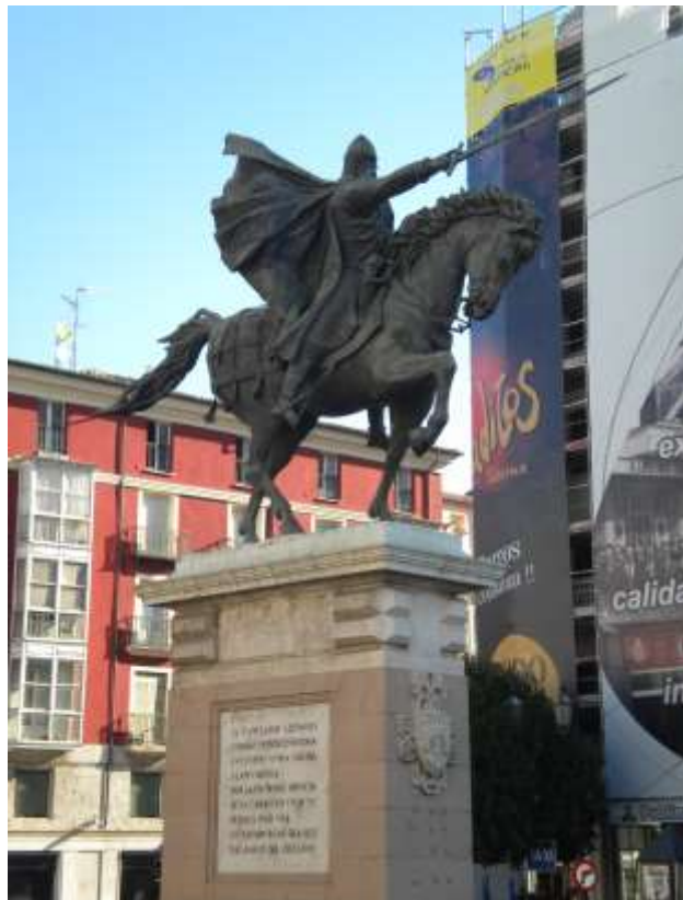
Burgos, statua equestre di Cid Campeador

Tra i primi esempi di lingua spagnola scritta, il poema del "Cantar de Mio Cid" venne completato intorno al 1206, probabilmente perché la corona di Spagna aveva la necessità di creare un suo eroe nazione, una figura necessaria per la mobilitazione nazionale richiesta dalla lunga Reconquista.