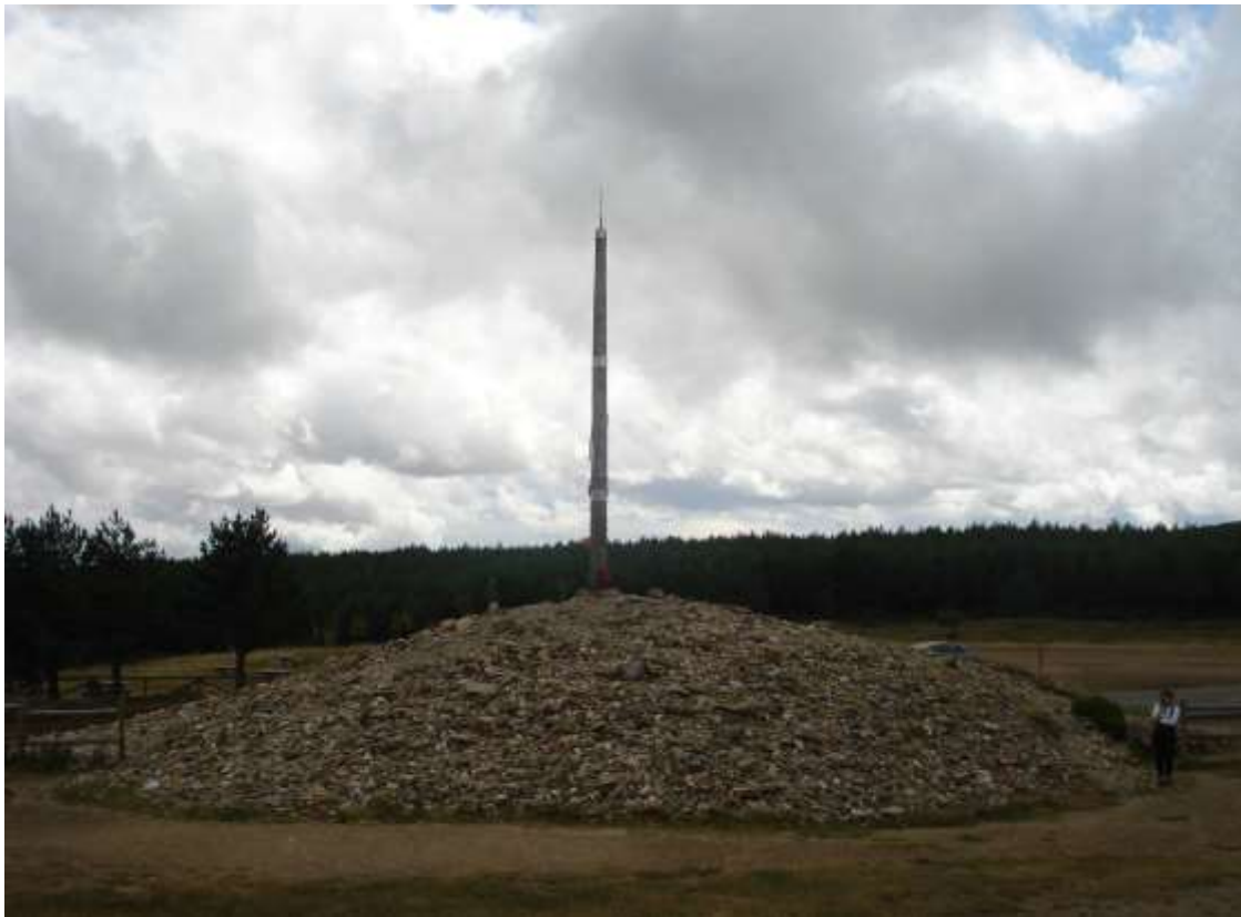
Cruz de Hierro

Si giunge poi ad ASTORGA e da lì si affronta sicuramente uno dei tratti più faticosi del Cammino, la salita per CRUZ DE HIERRO, 1540 m., che è soprattutto uno dei luoghi più affascinanti del pellegrinaggio: un alto palo di legno, tra l'azzurro dell'aria ed il verde del bosco; in cima una croce di ferro e ai piedi una montagna di pietre portate dai pellegrini; poi bandane, fogli, foto, parole scritte nella carta o incise sulla superficie dell'ardesia, spesso in ricordo di persone care che non ci sono più.