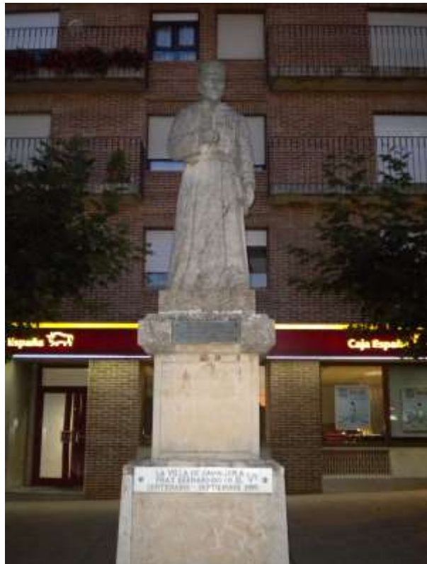
Bernardino de Sahagun – Sahagun

Il lavoro di Sahagun è conosciuto grazie ad un manoscritto chiamato Codice Fiorentino; scritto in nàhuatl , dopo una richiesta delle autorità spagnole fu scritto anche in casigliano: la "Historia general de las cosas de Nueva Espana". Per le sue critiche al disordine sociale introdotto dalla conquista spagnola nella Nuova Spagna, nel 1577 Filippo II promulgò un'ordinanza regia in cui vietò a chiunque di prendere conoscenza e di contribuire alla diffusione di tale opera, che sarà pubblicata soltanto nel XIX secolo; fortunatamente il frate ne conservò una copia, visto che l'originale andò perduto.