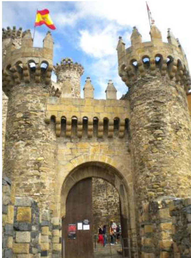
Castello Templare – Ponferrada

Tale potere suscitò le preoccupazioni del re di Francia Filippo il Bello, che ordì un complotto ai danni dei Templari accusandoli di empietà ed eresia: nel 1307 furono arrestati con 111 capi di imputazione, imprigionati e torturati per ottenere delle confessioni; con la bolla Vox in Excelso del 1312 il Papa soppresse per via amministrativa l'ordine del Tempio e successivamente trasferì tutti i beni agli Ospitalieri. I dignitari dell'ordine, tra cui il Gran Maestro Jacques de Molay, furono condannati al carcere a vita, ma quando tutto sembrava concluso il Gran Maestro ed il precettore di Normandia Geoffroy de Charnay ritrattarono le confessioni e per questo furono arsi vivi.