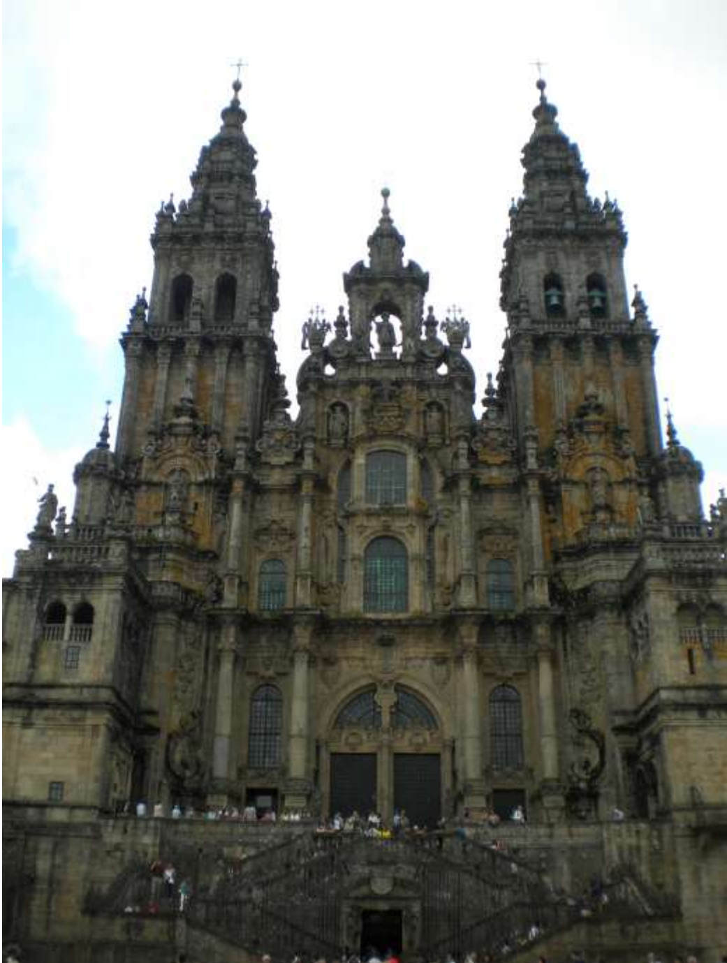
Cattedrale di Santiago de Compostela