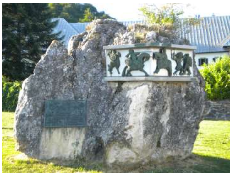
Monumento alla "Battaglia di Roncisvalle" – Roncisvalle