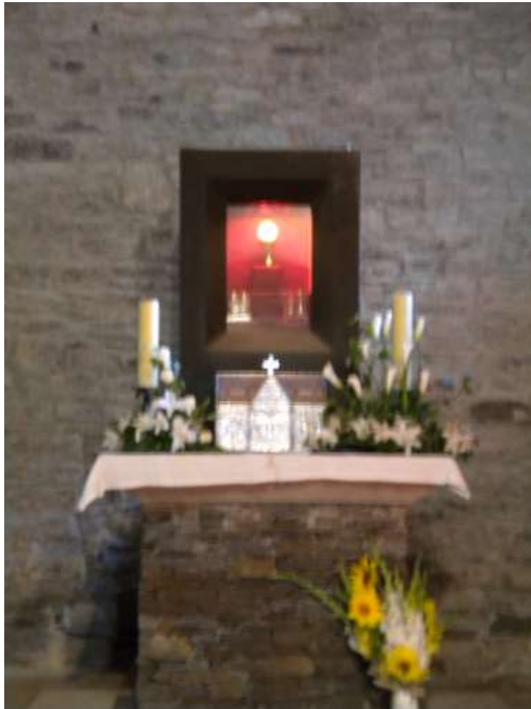
Santa Maria la Real – O'Cebreiro

Nella chiesa di Santa Maria la Real è conservato un particolare oggetto di culto: il calice del miracolo ( galiz de milagro ). Narra la leggenda che, in un gelido giorno di inverno, un contadino della zona si arrampicò fin quassù per seguire la messa; quando il prete lo vide arrivare pensò fosse matto per venire a seguire una messa con una tempesta come quella, ma in quell'istante il vino si trasformò nel sangue di Cristo; il prete lasciò cadere il calice ed il liquido si versò sui paramenti dell'altare che oggi sono ancora lì chiusi in una teca.